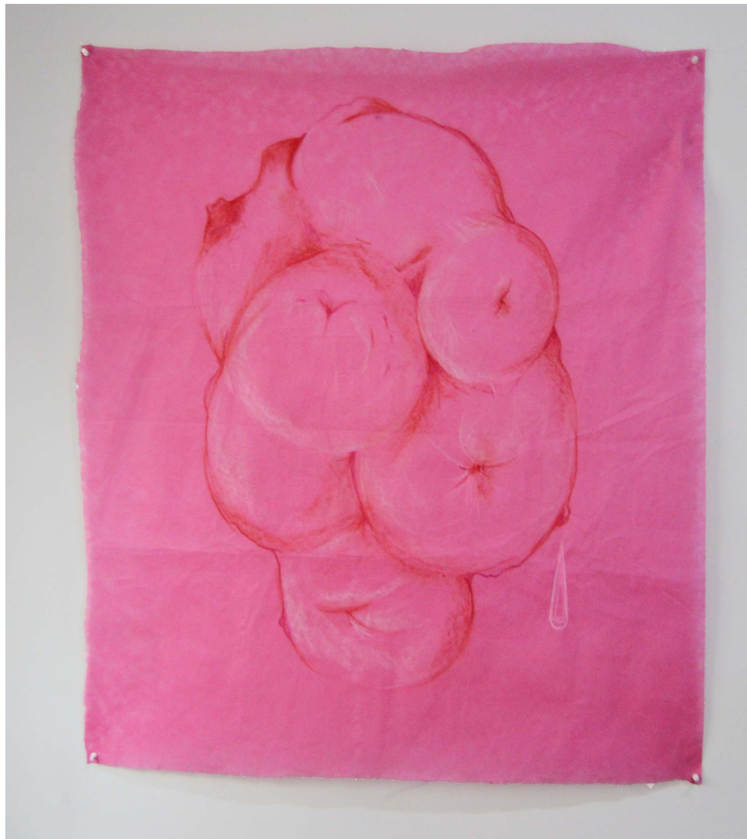
Peyón, 2022 106 x 92 cm. Pastel y crayola sobre peyón