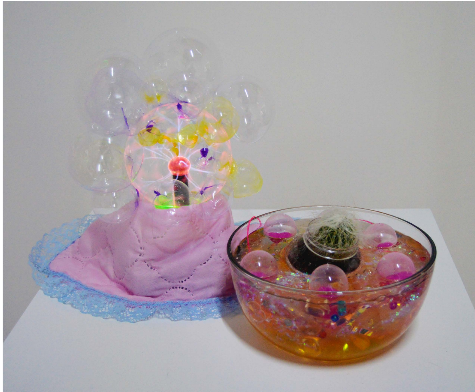
Burbujas de cristal, 2022 Bola de plasma, pecera, slime, cactus, vaciados en epox y pelo artificial

Por medio de los mismos recursos de lo táctil, quise contraponer objetos que me hacen pensar en fragilidad, y a la vez contención. Al centro un cactus ajeno a este escenario escurriente de cristales, como un desierto chiquito, dónde lo punzante es rodeado de varias esferas con arena y agua, culitos con pelo, iluminados a su vez por un plasma contenido en una bola de cristal que al tacto quema, pero solo un poco. El cristal como cuerpo que resguarda, pero lastima. Más como un juego asmr, dónde dan ganas de hundir los dedos, reventar burbujas, o sentir el plasma centelante.