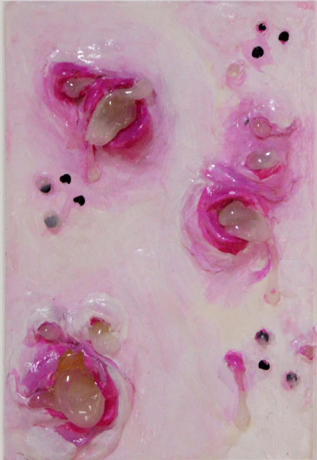
Squeeze me #2, 2022 15 x 10 x 3 cm. Silicón, arcilla, acrílico, Sobre bastidor de madera