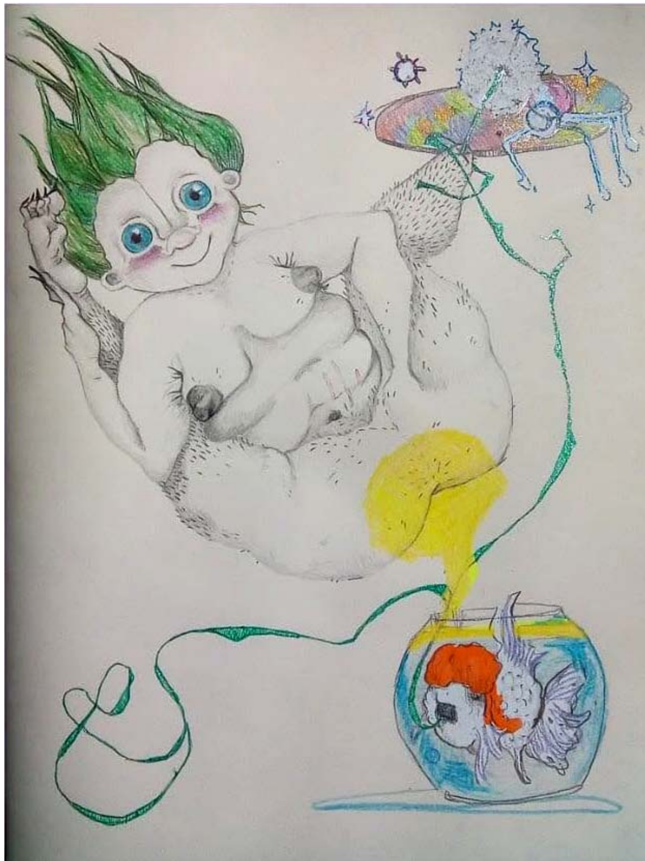
Troll con diente de león y pez orunda, 2022 27 x 21cm Dibujo a lápiz, crayones y plumas de gel.