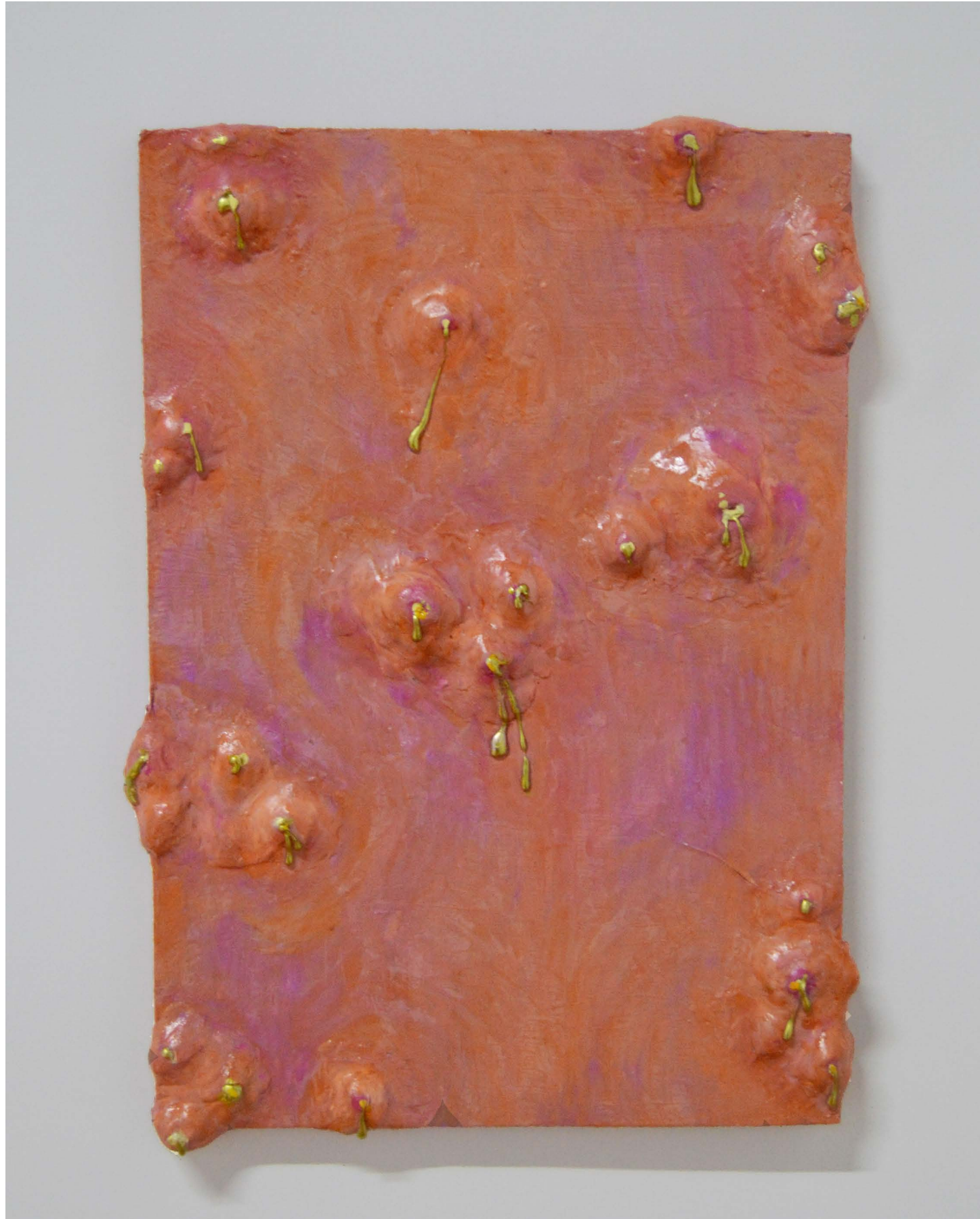
Oro líquido, 2022 39 x 29 x 3 cm. Silicón, arcilla, acrílico sobre bastidor de madera