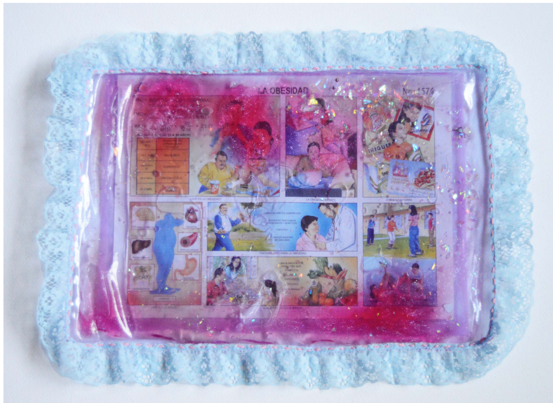
La obesidad, 2022 Serie: el lenguaje y sus alianzas gordo-odiantes 32 x 39 x 1 cm. Monografía de obesidad, plástico, slime, listón